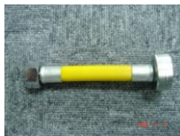
《散水栓・アングル止水栓》仕様